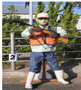
『イノシシハンター』