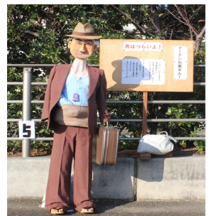
『フーテンの 寅さん』