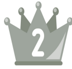
壱部地区 『アンパンマン』