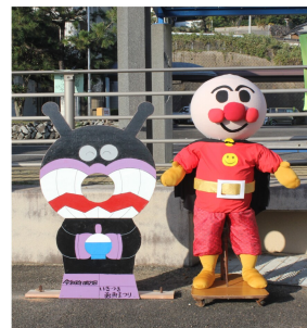
『アンパンマンと バイキンマン』