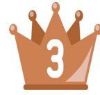
堺目地区 『りんごちゃん』