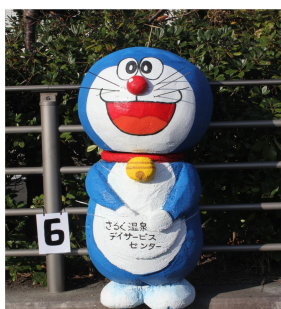
『ドラえもん ドラミちゃん』