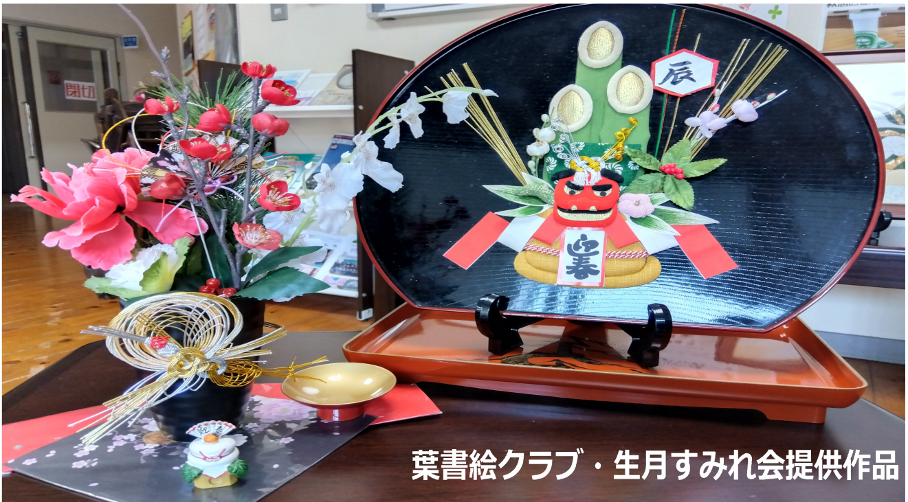
葉書絵クラブ・生月すみれ会提供作品

あけましておめでとつございます。 ご家族お揃いで輝かしく新年を迎えられたことを心からお慶び申し上げます。